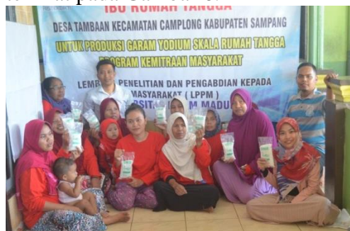
Gambar 6. Kemasan garam yodium

Garam yodium yang dibuat kemudian dikemas dengan kemasan 250 gram seperti terlihat pada Gambar 6.