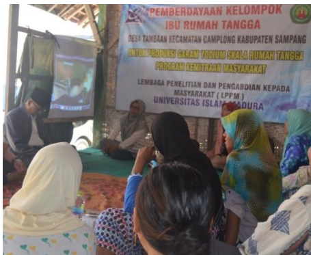
Gambar 4. Pemaparan proses pembuatan garam yodium

Pelatihan pembuatan garam yodium dilakukan dengan pemaparan dan diskusi cara membuat garam yodium seperti terlihat pada gambar 4. Selanjutnya para peserta langsung praktek membuat garam yodium. Gambar 5 memperlihatkan kegiatan pelatihan pembuatan garam yodium.