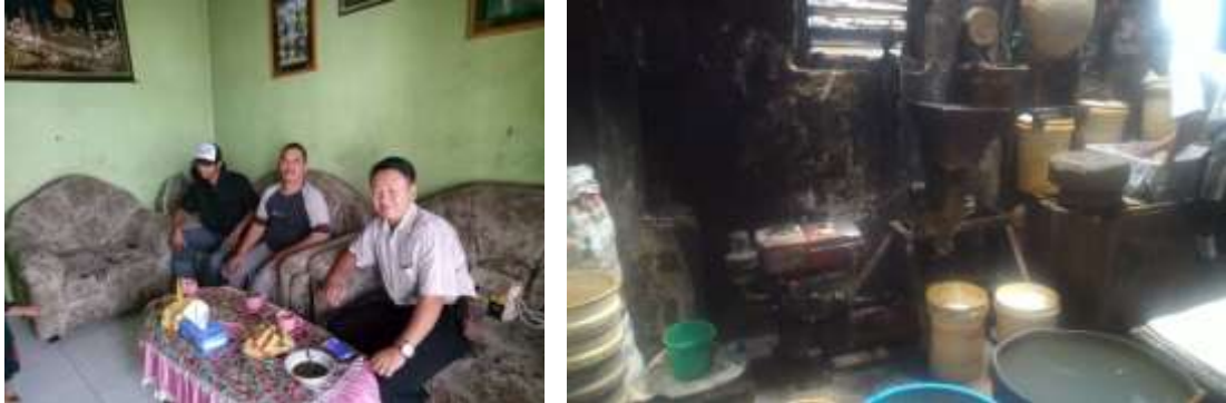
Gambar 1. Pertemuan dengan mitra dan kondisi terkini mesin dan peralatan mitra

tahu dengan ukuran 45 cmx 45 cm. Sehingga dalam 1 hari didapatkan 160 bungkus per hari.