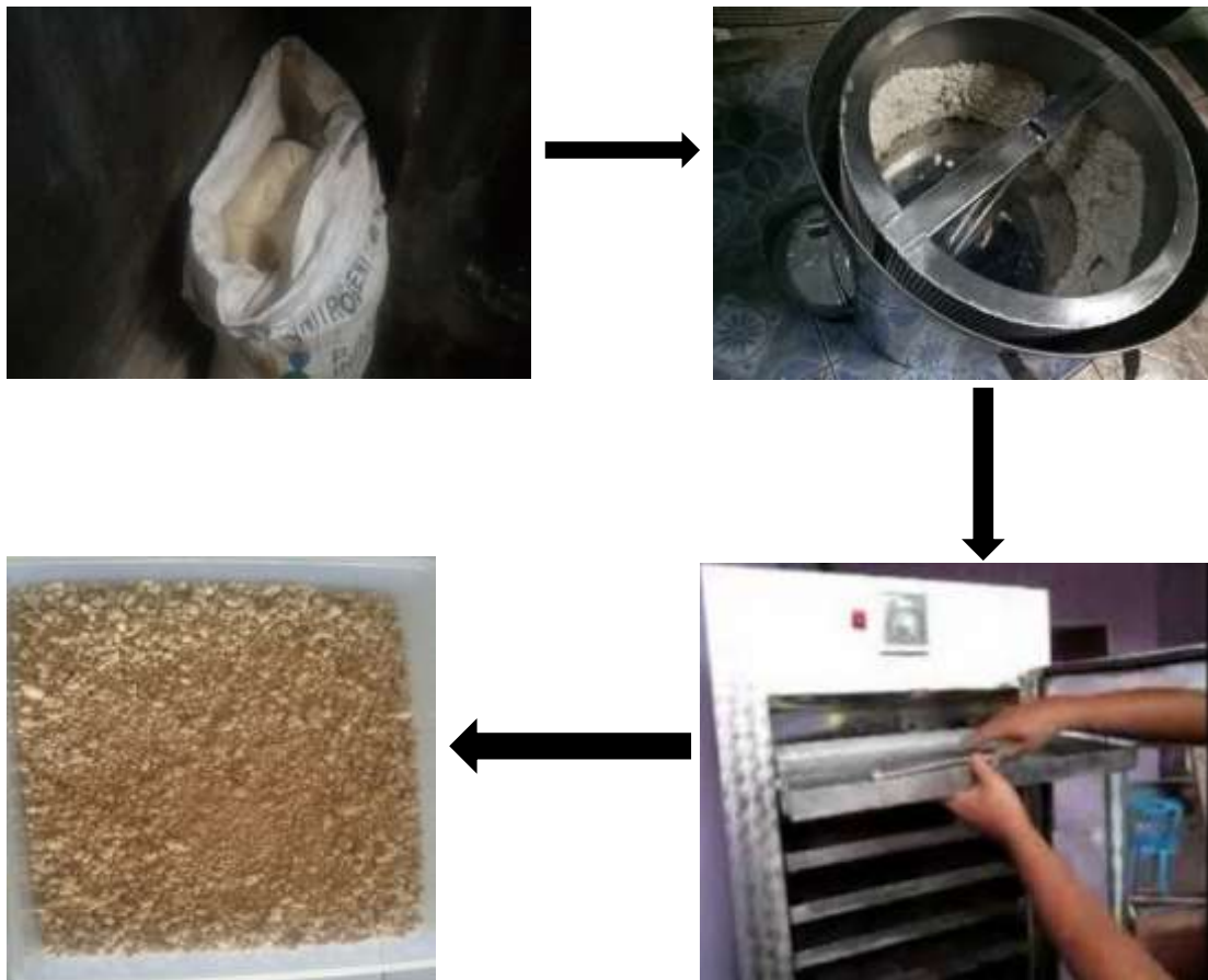
Gambar 4. Proses pengeringan ampas tahu

Olahan produk ampas tahu dapat digunakan dalam bentuk semi basah atau ampas tahu kering, olahan produk ampas tahu basah dapat digunakan menjadi isi kulit lumpia dan kerupuk, sedangkan olahan ampas tahu kering dalam bentuk produksi roti.