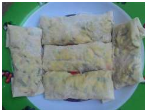
Gambar 5. Lumpiah ampas tahu

Olahan produk ampas tahu dapat digunakan dalam bentuk semi basah atau ampas tahu kering, olahan produk ampas tahu basah dapat digunakan menjadi isi kulit lumpia dan kerupuk, sedangkan olahan ampas tahu kering dalam bentuk produksi roti.